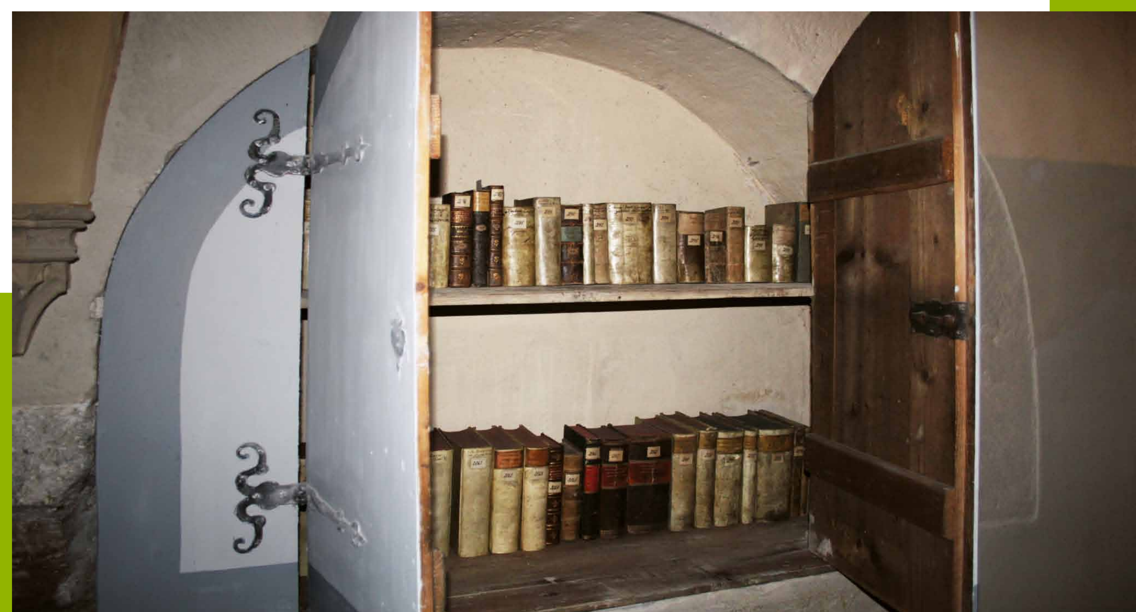
Aufbewahrung der Bücher am historischen Ort in der Oberkirche

Auch die Kirchenbibliothek Arnstadt wurde in den zurückliegenden Jahren erschlossen. Sie ist eine der bedeutendsten evangelischen Kirchenbibliotheken in Thüringen und vollständig in ihren historischen Räumen und in der historischen sachsystematischen Aufstellung erhalten. Ziel des vom Freistaat Thüringen geförderten Projekts war die Erschließung und Sicherung des Buchbestands und der Bestandsnachweis im Verbundkatalog des GBV sowie die Erfassung der Titel in den nationalbibliographischen Verzeichnissen der im deutschen Sprachraum erschienenen Drucke des 16., 17. und 18. Jahrhunderts (VD16, VD17, VD18). Es hat sich herausgestellt, dass 337 Titel noch nicht im Gemeinsamen Verbundkatalog nachgewiesen waren und Unikate im Alleinbesitz der Kirchenbibliothek Arnstadt sind.