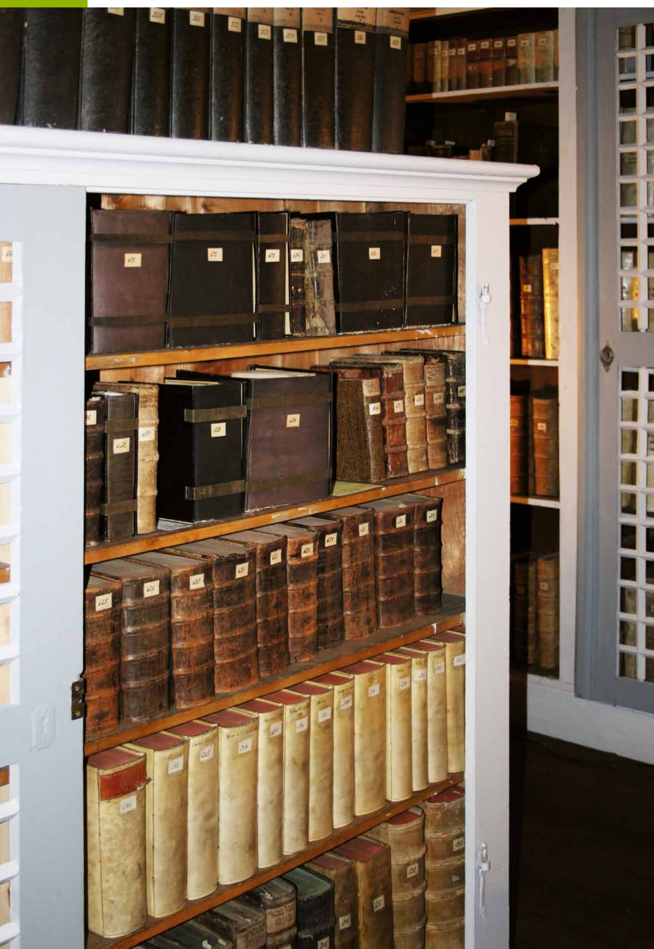
Kirchenbibliothek Arnstadt in historischer sachsystematischer Aufstellung