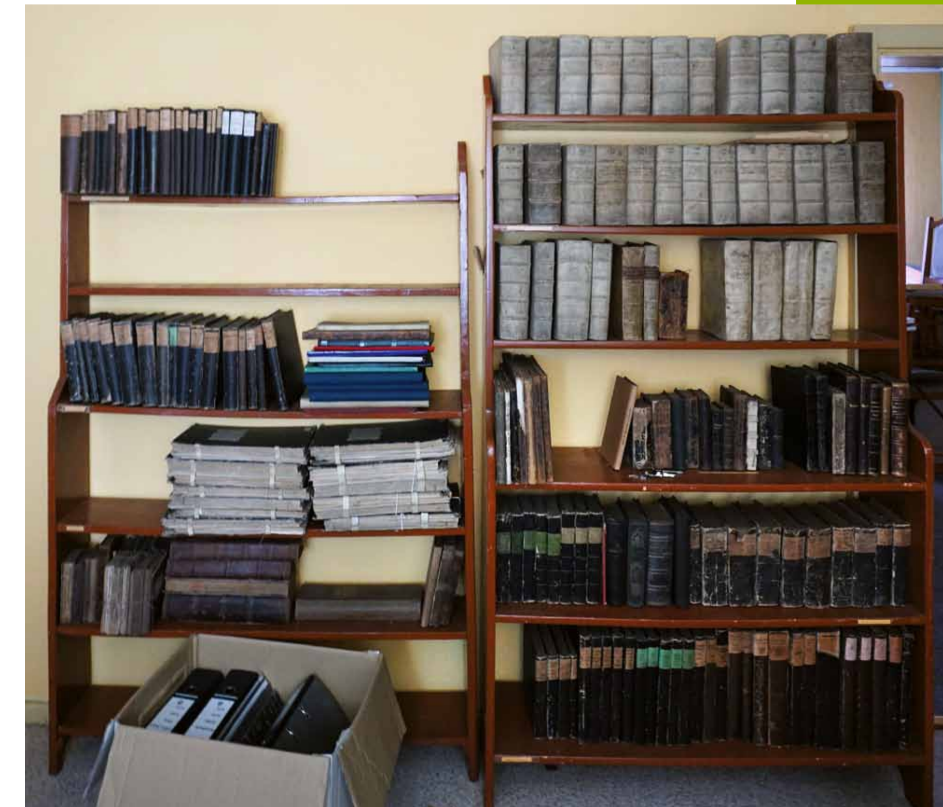
Bibliothek mit kleinem Buchbestand: Kirchenbibliothek Göllingen