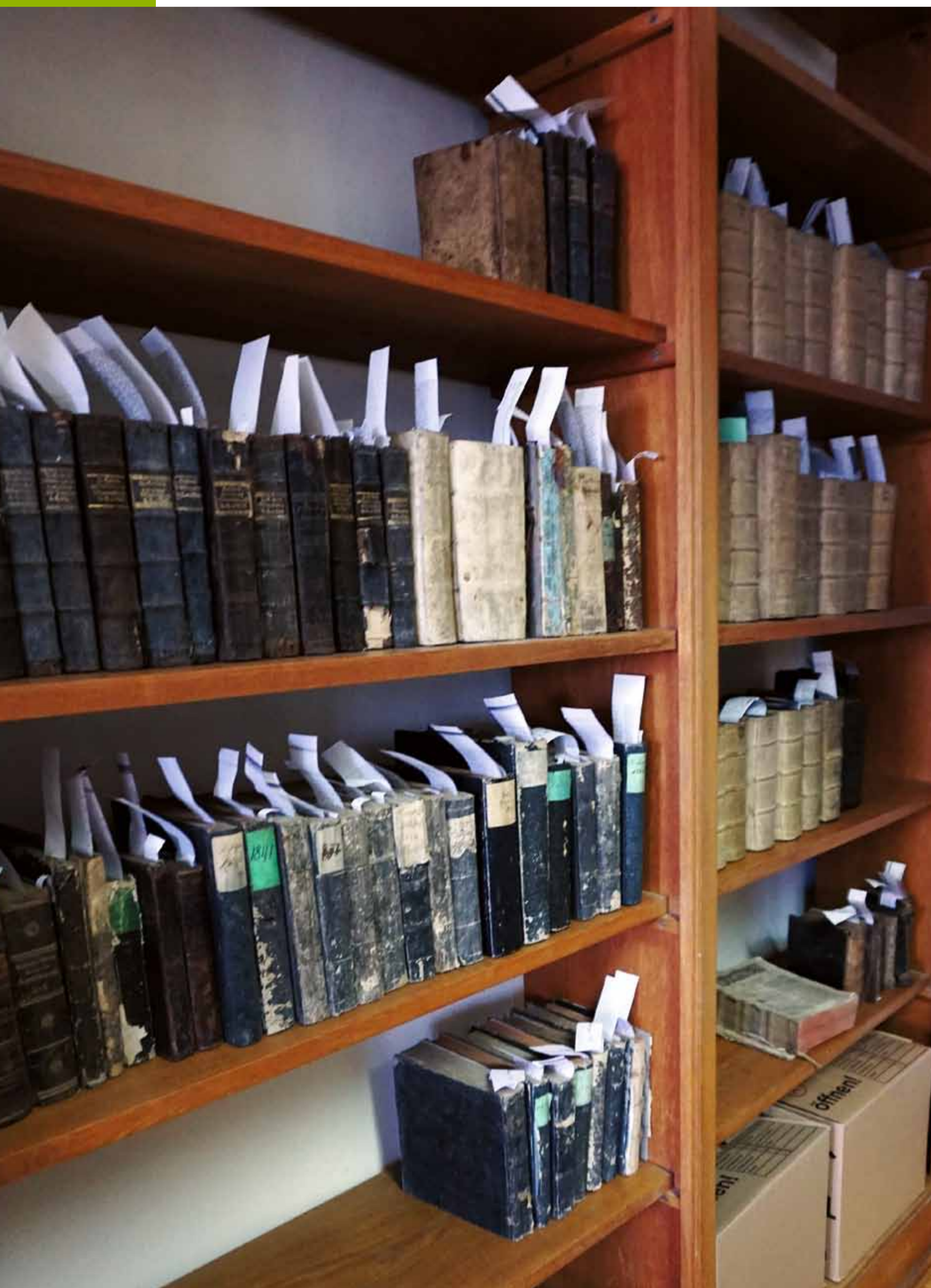
Zur Katalogisierung in die Forschungsbibliothek Gotha verbrachte Bände einer Kirchenbibliothek

Als Orte kultureller Überlieferung sind evangelische Kirchenbibliotheken für die Forschung von hoher kulturgeschichtlicher Bedeutung. Doch sind bisher nur wenige erforscht. So sind auch nur einzelne Kirchenbibliotheken schon in Verbundkatalogen katalogisiert und ihre Bestände damit für die Forschung nutzbar gemacht worden.