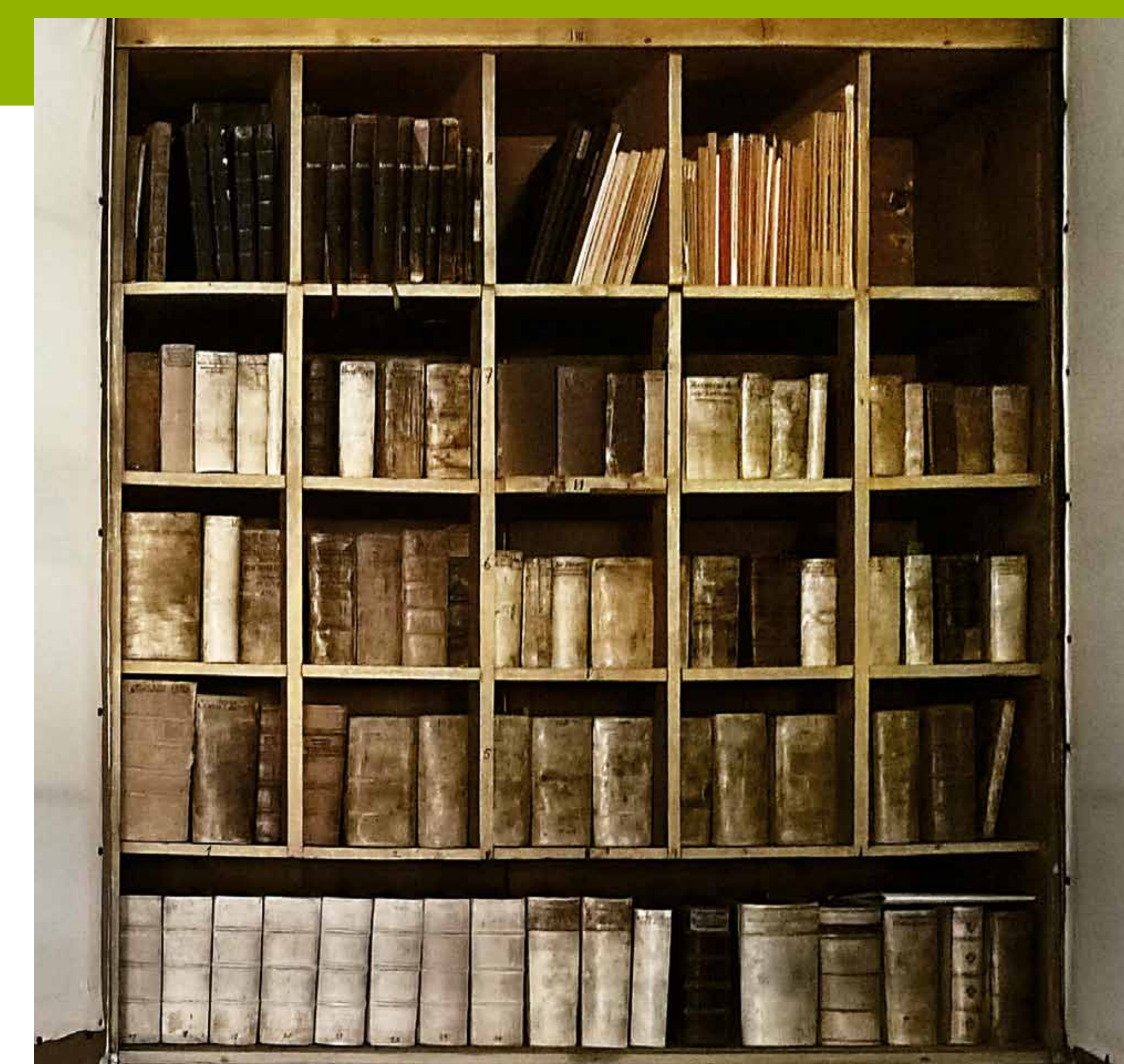
Bücherschrank in der Unterkirche Bad Frankenhausen