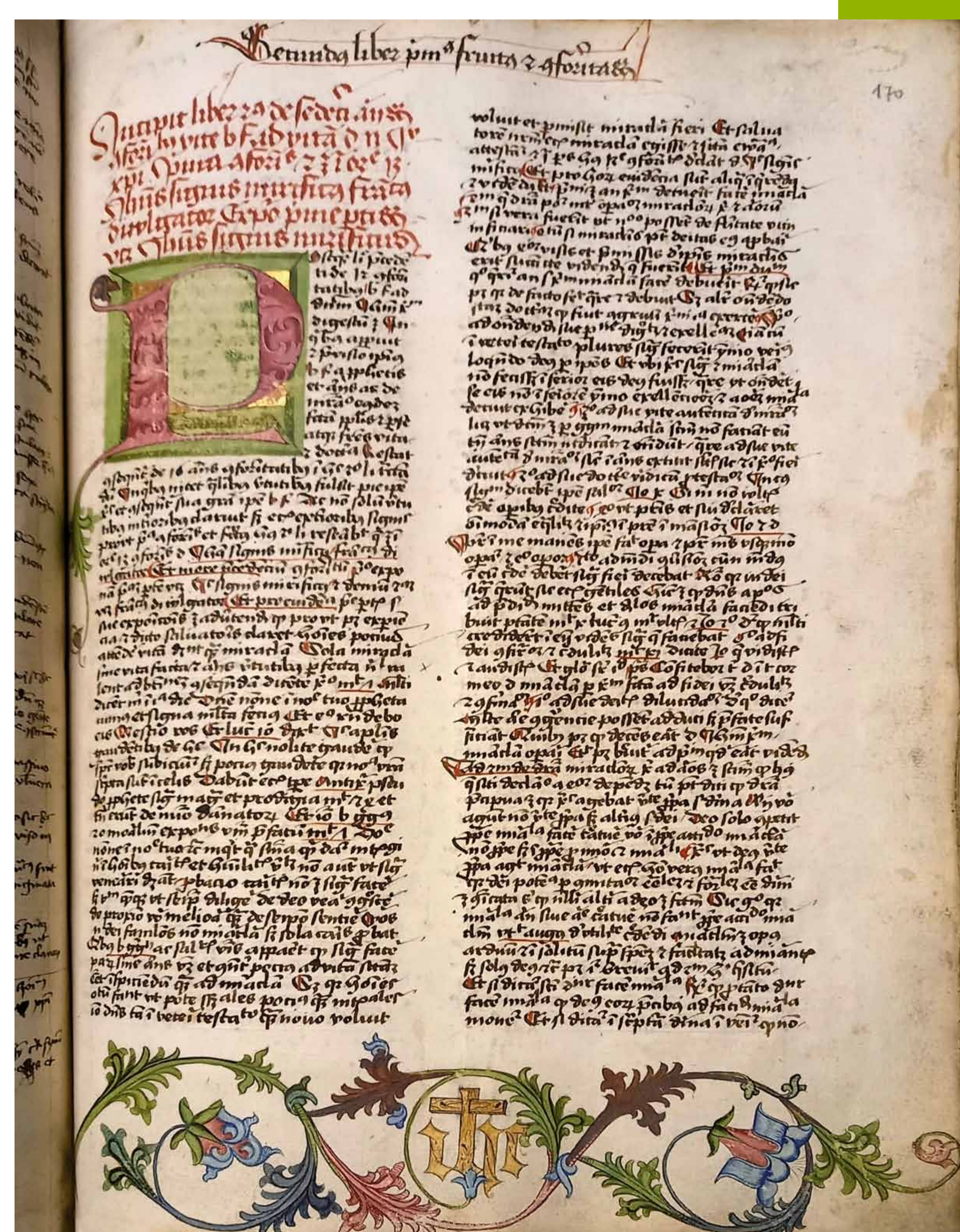
Bartholomäus de Pisa: Opus de conformitate vitae Christi, Beginn des 2. Teils mit Zierinitialen und Blattschmuck; Handschrift, 1482