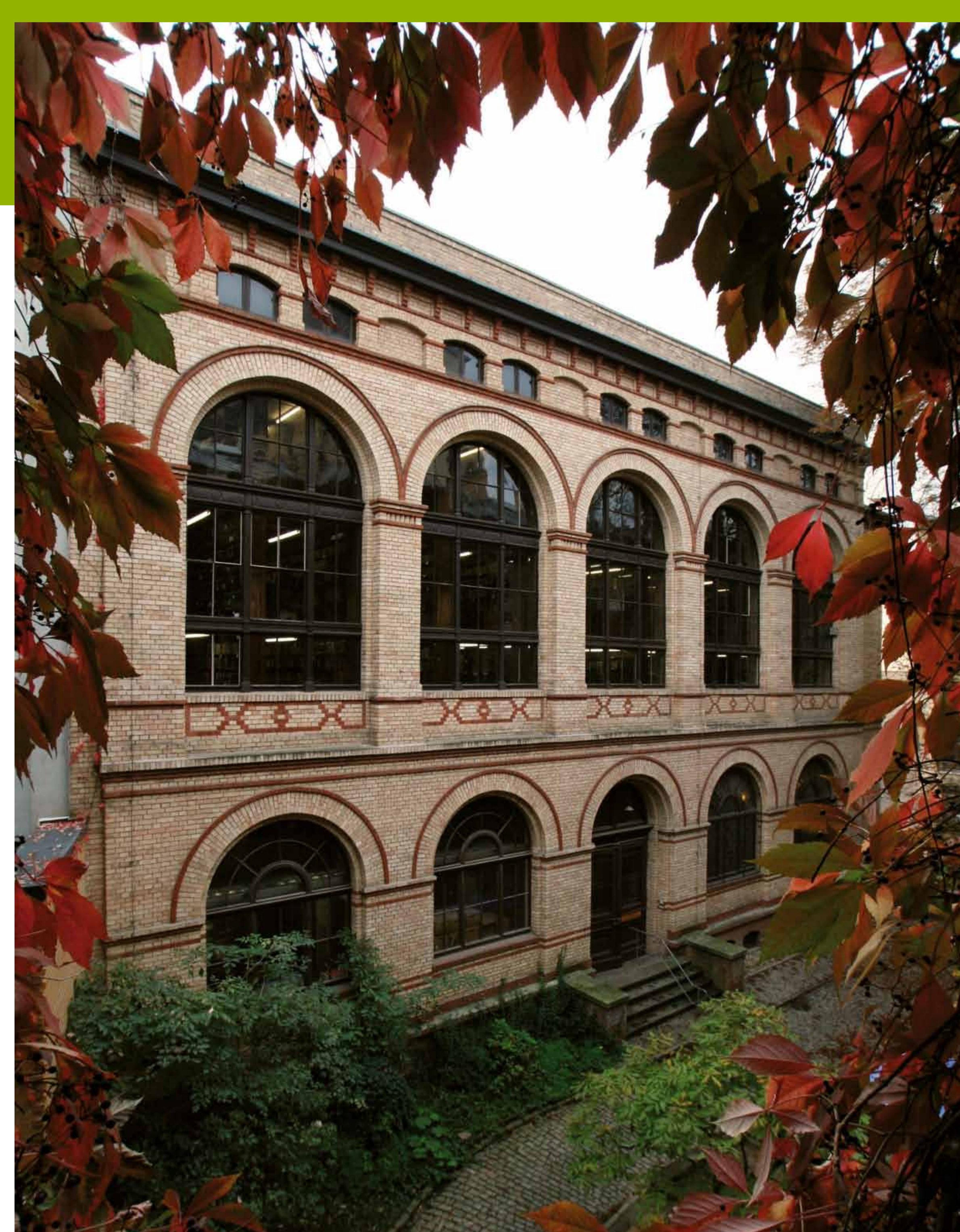
Marienbibliothek: Außenansicht des Bibliotheksgebäudes

In die Marienbibliothek sind vier umfangreiche, geschlossen erhalten gebliebene Gelehrtenbibliotheken aus dem 17. und 18. Jahrhundert eingegangen. So zählen neben wertvollen Bibelausgaben, theologischen Werken und einer umfangreichen Sammlung von Gesangbüchern auch Drucke anderer Wissenschaftsbereiche, wie z.B. Medizin, Geographie, Astronomie, Physik und Chemie, aber auch der frühen Reiseliteratur zum Bestand. Er umfasst heute 36000 Bände, darunter mehr als vierhundert Inkunabeln und ca. dreihundert Handschriften.